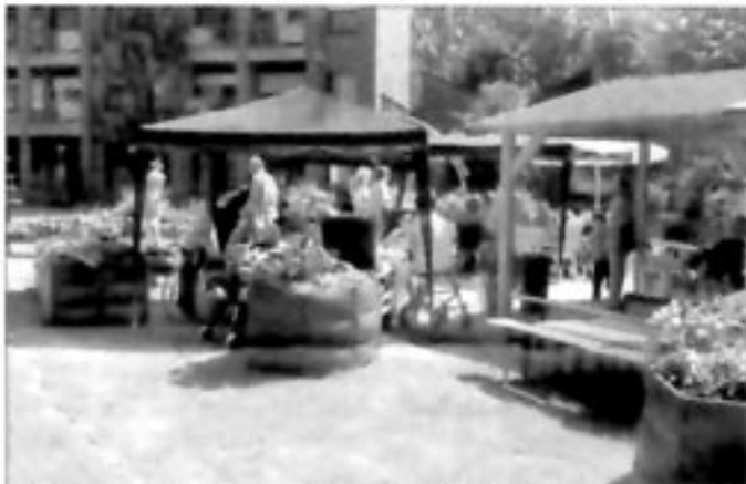
Der neue Erlebnisgarten beim Bethesda-Altenheim

ren. Anders verhält es sich mit Menschen, deren Mobilität und Psyche eingeschränkt sind, wie bei zahlreichen Bewohner des Gronauer Bethesda-Altenheimes.