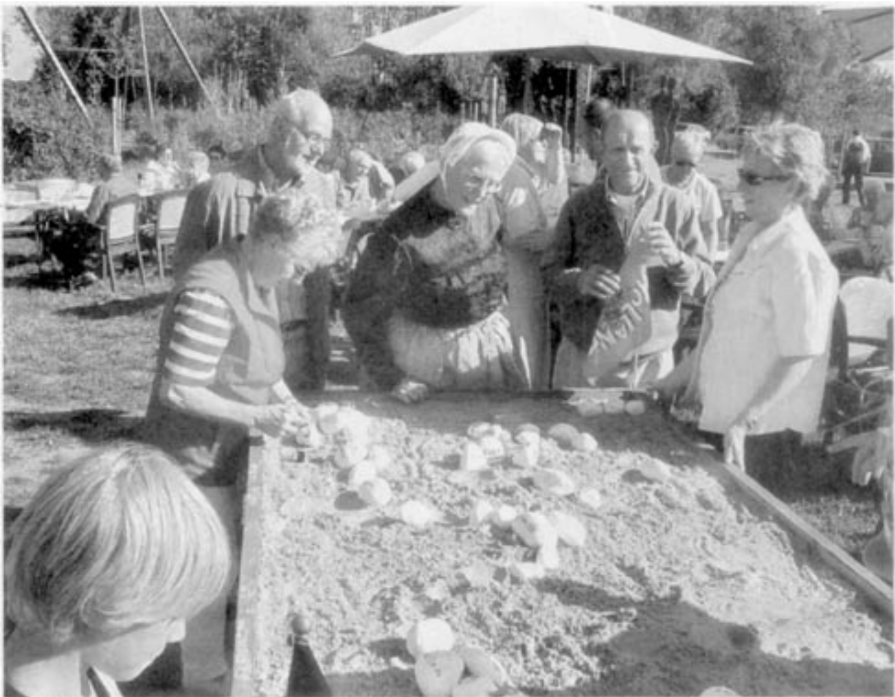
Aus Grenzsteinen wurden „Wunschsteine“ – das war nur eine Aktion während der grenzüberschreitenden Seniorenbegegnung.