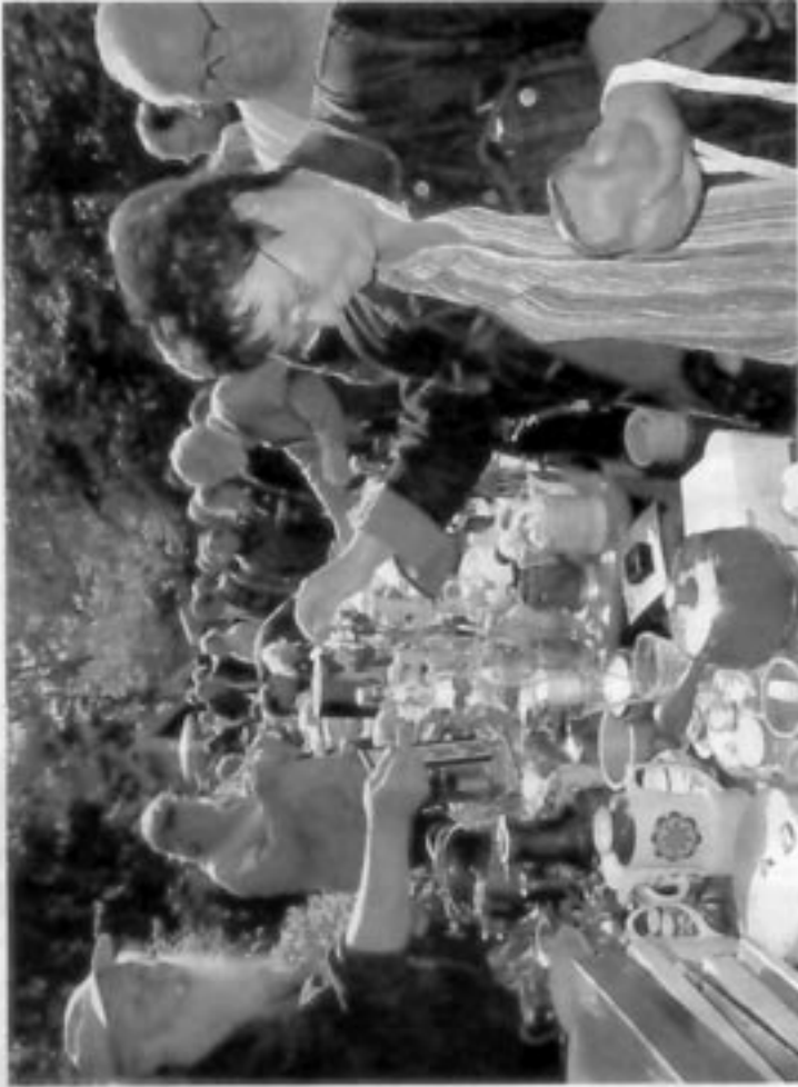
Eldorado für Schnäppchenjäger: Der Flohmarkt der Diakonie war wie stets bestens besucht.

sie entführte. Darüber hinaus schwang die Trachtengruppe des Heimatvereins ihr Lanzbein und die Kinder der Kita „Astrid Lindgren“ und „Zum Regenbogenland“ wurden bei ihren Aufführungen – wie beispielsweise dem „Regenbogenfisch“ – mit viel Applaus bedacht. Mit ihrem Angriff auf die Lachmuskeln traf Putzfrau Lisbeth bei den Zuschauern ebenfalls voll ins Schwarze, wie auch die Aktiven des Gronauer Karate-Vereins, deren